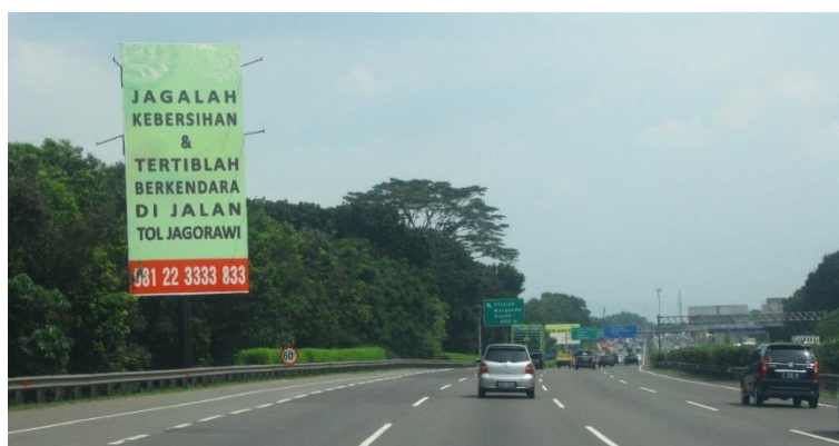
Gambar 2 Media Luar Griya Nonkomersial dengan Penyampaian Menggunakan Tulisan

Komponen isi dan cara penyampaian media luar griya memberikan kontribusi terbesar senilai 90,1% terhadap media luar griya dalam mewujudkan tercapainya keselamatan pengguna jalan tol. Kontribusi yang besar tersebut mengindikasikan bahwa komponen isi dan cara penyampaian adalah komponen yang sangat penting untuk diperhatikan. Komponen isi dan cara penyampaian media luar griya harus mempertimbangkan perancangan isi dan cara penyampaian media luar griya yang cenderung tidak vulgar dan provokatif yang akan menyita waktu pengemudi sehingga menghilangkan fokus dalam berkendara. Media luar griya nonkomersial terutama media luar griya berisi informasi nonkomersial seperti kondisi lalu lintas dan kondisi jalan akan membuat pengemudi dapat mengambil sikap dalam berkendara. Media luar griya nonkomersial dan cara penyampaian menggunakan tulisan diperlihatkan pada Gambar 2.