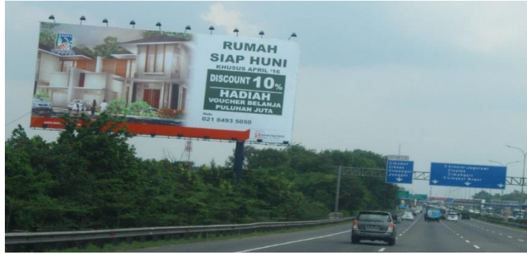
Gambar 5 Media Luar Griya Billboard dengan Dimensi > 100 m 2