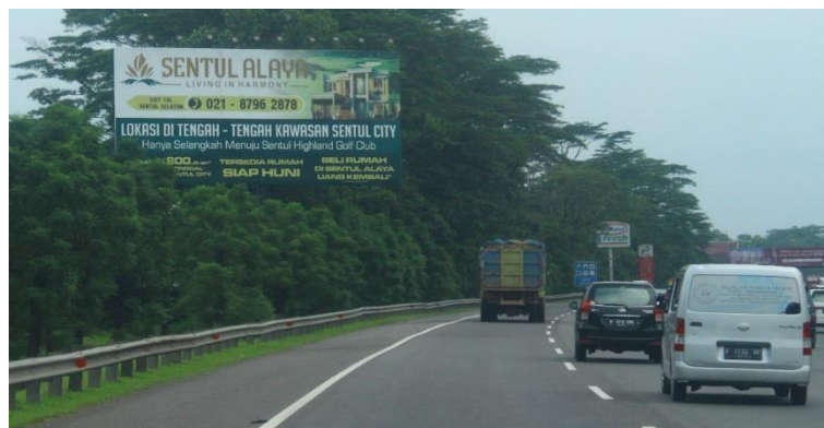
Gambar 4 Media Luar Griya Billboard dengan Lebih dari 10 Kata dan Ukuran Huruf Sulit Dibaca