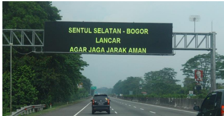
Gambar 3 Media Luar Griya VMS di Tol Jagorawi

banyak ditemukan media luar griya yang memiliki pesan banyak, penggunaan huruf yang sulit dibaca, serta jumlah isi pesan lebih dari 10 kata, seperti diperlihatkan pada Gambar 4.