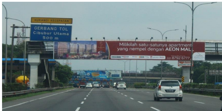
Gambar 6 Perletakan Media Luar Griya Billboard Berdekatan Dengan Rambu Lalulintas