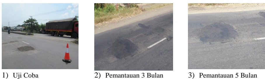
Gambar 18 Hasil Uji Coba di Ruas Jalan Cirebon-Cikampek Arah Cikampek KM 64+000