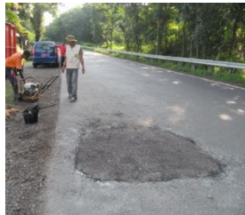
1) Uji Coba