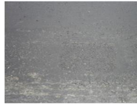
b. Pemantauan Desember 2012