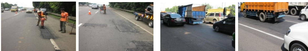
a. Uji Coba Bulan April 2014