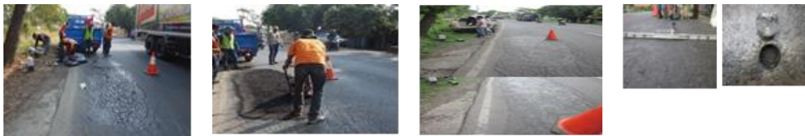
a. Foto Saat Uji Coba