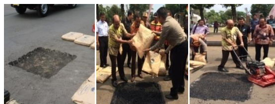
Uji Coba Bulan Agustus 2014