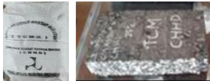
Gambar 8 Ilustrasi Produk TCMA

dimodifikasi) dengan bahan tambah (aditif) berbasis air (Nono, 2015). Bahan pengikat campuran, berupa bahan peremaja hangat, yang digunakan adalah aspal cair yang dimodifikasi yang tingkat kekentalannya sesuai dengan temperatur pemompaan dan memiliki titik nyala lebih tinggi dari 150 °C. Temperatur pencampuran campuran hangat asbuton ini antara (120°-125°) C. Asbuton yang digunakan berasal dari Lawele sebanyak 25% dan gradasi agregat campuran yang dicoba adalah gradasi semi terbuka. Ilustrasi produk TCMA dengan kantong kemasan dengan berat 25 kg disajikan pada Gambar 8.