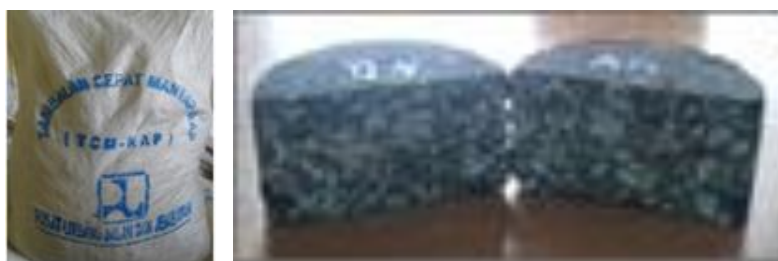
Gambar 14 Produk TCM-RAP

Selanjutnya dilakukan uji coba TCM-RAP hasil pengujian di laboratorium di lapangan pada bulan Juni 2015 di beberapa tempat, seperti terlihat pada Gambar 15 hingga Gambar 20. Untuk Ruas Cirebon-Cikampek Arah Cirebon, pada umumnya performa tambalan masih baik kecuali TCM dengan 50% RAP pada lokasi KM 55+400 sudah mengalami penurunan dan pergeseran, sedangkan yang TCM dengan 70% RAP masih baik. Pada umur sekitar lima bulan masih terdapat TCM yang masih utuh, yaitu pada lokasi KM 166+500. Performa tambalan TCM-RAP Ruas Cirebon-Cikampek Arah Cikampek pada umumnya masih baik. Hasil pemantauan setelah umur lima bulan pada KM 19+500 sedikit mengalami pelepasan butir halus dan pada KM 64+000 masih baik. Namun di