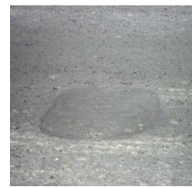
b. Pemantauan Desember 2012