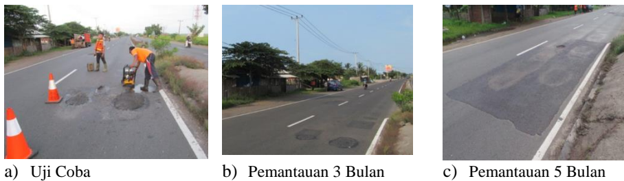
Gambar 16 Hasil Uji Coba di Ruas Jalan Cirebon-Cikampek Arah Cirebon KM 166+500