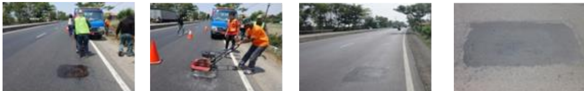
a. Foto Saat Uji Coba