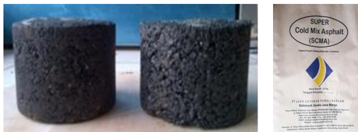
Gambar 2 Ilustrasi Produk TCM-SCMA

Pengembangan bahan tambalan cepat mantap, baik dari campuran beraspal panas maupun dari campuran beraspal dingin dengan aspal emulsi, dengan bahan tambah (aditif) pelarut organik telah dilakukan pada tahun 2012 dan diuji coba pada skala lapangan pada tahun 2014 (Nono, 2014). TCM dari campuran beraspal panas menggunakan bahan pengikat aspal Pen 60 dan TCM dari campuran beraspal dingin menggunakan bahan pengikat aspal emulsi CSS-1h. Kedua campuran TCM ini dapat menggunakan agregat dengan gradasi menerus (rapat) atau dengan gradasi semi terbuka. Produksi tambalan cepat mantap SCMA ini telah dikerjasamakan dengan PT Jasa Layanan Pemeliharaan (dahulu bernama PT Sarana Marga Utama). Produk SCMA dikemas dalam kantong kemasan dengan berat 25 kg, seperti disajikan pada Gambar 2.