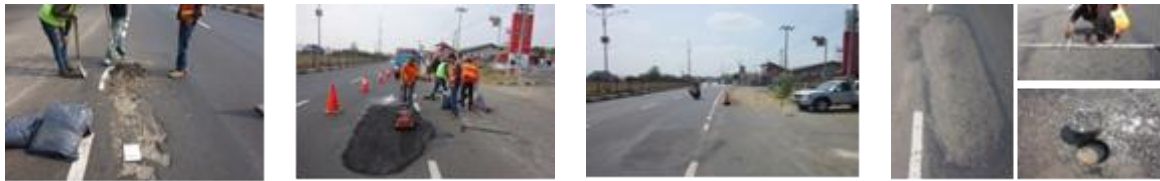
a. Foto Saat Uji Coba