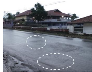
3) Pemantauan 5 Bulan