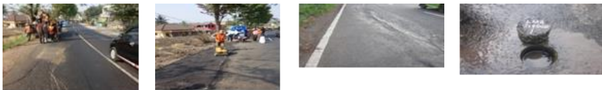
a. Foto Saat Uji Coba