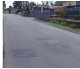
2) Pemantauan 3 Bulan