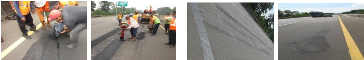
a. Uji Coba Bulan April 2014