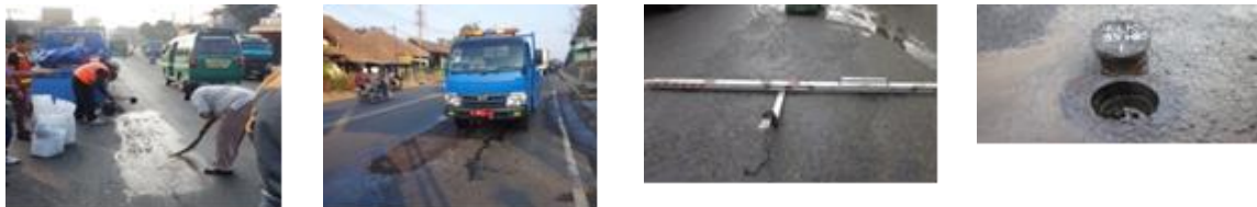
a. Foto Saat Uji Coba