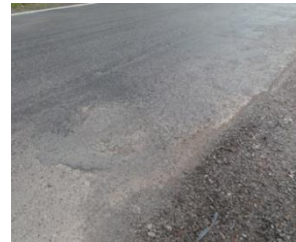
3) Pemantauan 5 Bulan