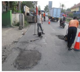
1) Uji Coba