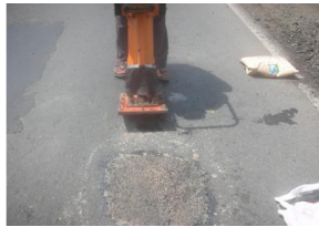
a. Uji coba bulan April 2012