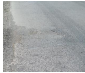
2) Pemantauan 3 Bulan