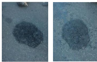
a. Uji coba bulan April 2012