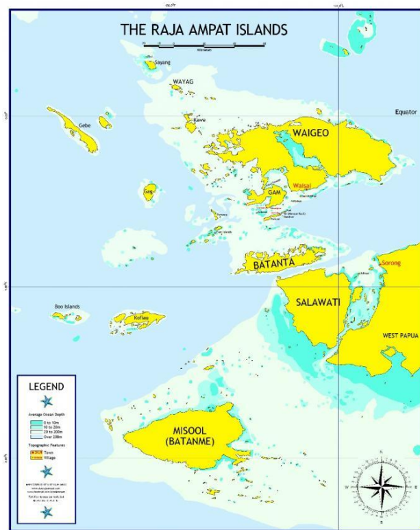
Gambar 1. Peta Kabupaten Raja Ampat

Raja Ampat adalah sebuah kabupaten dan merupakan bagian dari Provinsi Papua Barat. Raja Ampat adalah kepulauan yang terdiri dari banyak sekali pulau karang dan tersebar luas di seluruh wilayahnya. Namun demikian, Raja Ampat memiliki 4 pulau utama yang paling besar, yaitu Pulau Waigeo, Pulau Batanta, Pulau Salawati, dan Pulau Misool. Empat pulau besar inilah yang menjadi titik awal penyebaran seluruh penduduk Raja Ampat yang sebagian besar berprofesi sebagai nelayan. Wilayah perairan adalah daya tarik utama Raja Ampat, mengingat perairan Raja Ampat adalah salah satu dari 10 perairan terbaik di seluruh dunia. Hal ini didasarkan pada berbagai penelitian tentang kekayaan flora-fauna dan kelestarian alam laut yang dimiliki Raja Ampat. Secara geografis, Raja Ampat berada pada koordinat 01^{\circ}15'LU-2^{\circ}15'S & 120^{\circ}10'-121^{\circ}10'BT . Luas wilayah Kepulauan Raja Ampat adalah 46.108 km 2 .