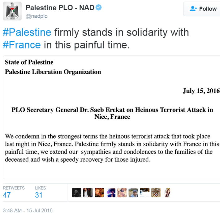
Gambar 2: Tweet mengenai Belasungkawa Palestina terhadap Aksi Teror di Paris

Selain melalui media sosial, Palestina juga aktif melakukan diplomasi publik melalui media online lainnya. Salah satunya adalah melalui website kepresidenan yang dimiliki oleh Presiden Palestina, Mahmoud Abbas. Dalam website kepresidenan yang dapat diakses melalui www.pres.ps , banyak dituliskan mengenai latar belakang dan biografi presiden, buku dan publikasi yang telah diterbitkannya, aktivitasnya sehari-hari sebagai seorang presiden, serta dokumentasi kegiatan kepresidenannya dari waktu ke waktu. Namun demikian, yang membedakan website ini dengan website presiden negara lain adalah adanya sebuah tab dalam website yang berjudul “ Road to Statehood. ” Dalam penjelasan di tab tersebut, secara detil dijabarkan bagaimana sejarah perjuangan Palestina sejak dulu hingga sekarang untuk menjadi sebuah negara merdeka. Terdapat pula sebuah pernyataan yang menarik, dimana ditulis bahwa “... the notion of a Palestinian entity or a Palestinian state came into