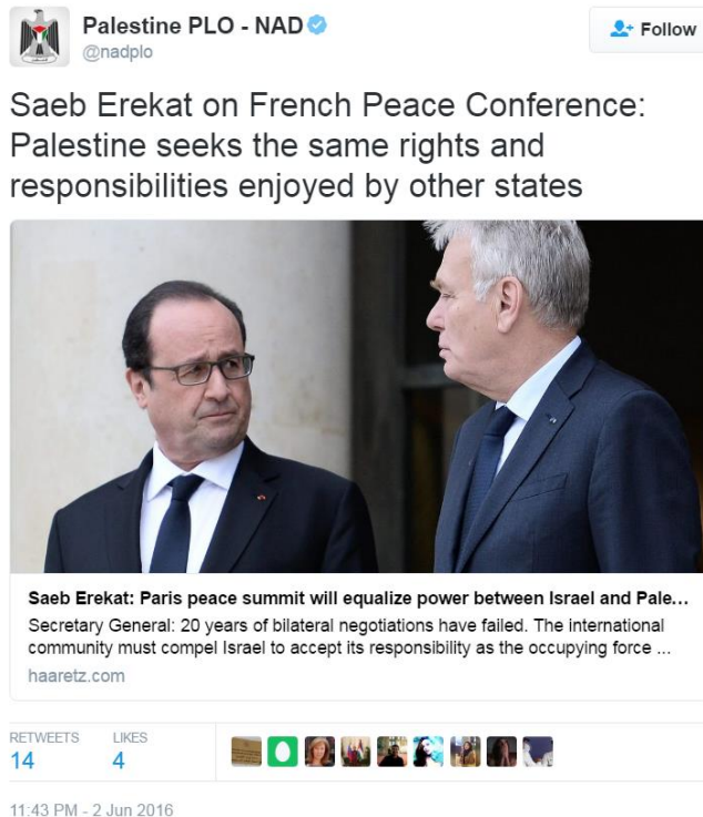
Gambar 1: Tweet mengenai Keterlibatan Palestina dalam French Peace Conference

Seperti negara lain pada umumnya, Palestina juga mengeluarkan pernyataan resminya ketika sebuah peristiwa penting terjadi di dunia internasional. Pada tanggal 15 Juli 2016, akun Twitter resmi PLO merilis pernyataan resminya yang menyatakan solidaritas dan belasungkawa sedalam-dalamnya terhadap korban aksi terorisme di Nice, Prancis. Yang menarik, tweet ini dimulai dengan kata “ State of Palestine, ” menunjukkan kedudukan Palestina dalam hal ini sebagai sesama negara yang memiliki status dan kedudukan setara dengan Prancis dan negara lainnya. Selain itu, Palestina juga menulis bahwa “... Palestina firmly stands in solidarity with France in this painful time, ” yang menyiratkan bahwa Palestina sebagai sebuah negara juga dapat merasakan situasi yang sedang dialami oleh negara Prancis.