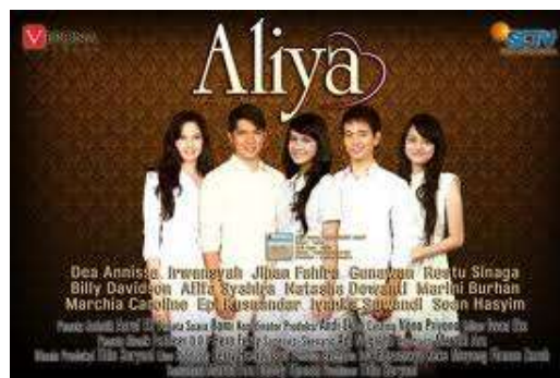
Gambar 3.2. Sinetron Aliya di SCTV