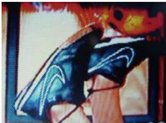
Gambar 5.6 Product placement Nike dalam Tendangan Si Madun