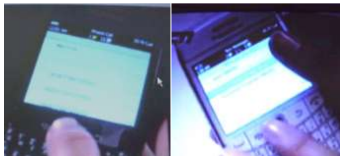
Gambar 5.2 Product Placement Blackberry Smartphone dalam Binar Bening Berlian