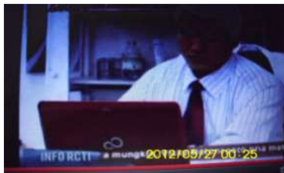
Gambar 5.4 Fujitsu dalam Binar Bening Berlian

Saat dokter menerangkan mengenai kecocokan gen Berlian dengan Yunus, laptop warna silver dengan logo Compaq disorot dari dekat. Sedangkan laptop dengan logo merek Fujitsu disorot dari dekat saat digunakan oleh Mirza di meja kerjanya.