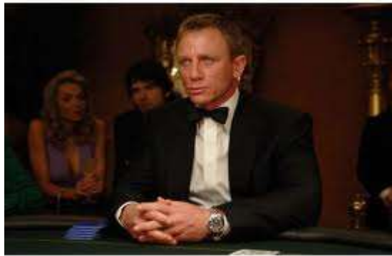
Gambar 2.2. Product Placement Jam tangan ‘Omega’ dalam James Bond

bertanya apakah Bond memakai Rolex, dan James Bond menjawab “Omega”. Gambar 2.2. merupakan salah satu contoh keberadaan product placement jam tangan merek ‘Omega’ dalam film James Bond.