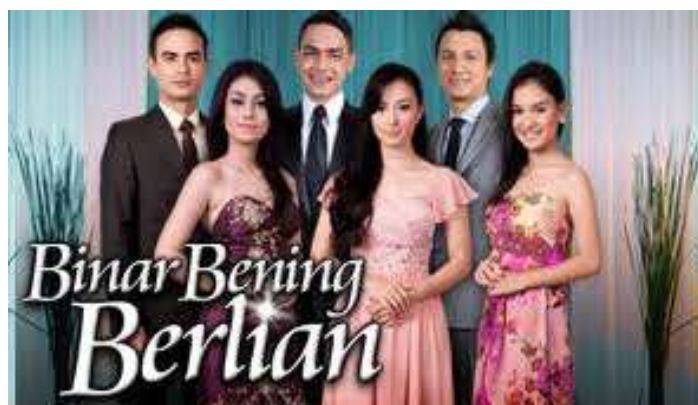
Gambar 3.1. Binar Bening Berlian di RCTI

Di sisi lain, Binar yang sangat iri akan perhatian dr. Mirza pada Bening pun mulai menyusun siasat agar perhatian itu teralih padanya. Begitupun dengan perhatian ayahnya, Yunus. Bahkan ketika tanpa sengaja Binar mengetahui rahasia terbesar ibu dan pamannya, Binar pun berusaha berbagai macam cara agar aib itu tidak terbuka, karena ia sangat membenci Hendri dan sangat mengagumi Yunus. (Thread of Pangeran, 9 Desember 2011)