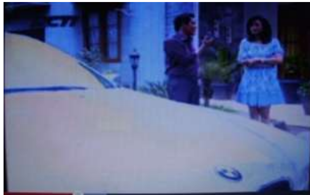
Gambar 5.3 Product placement BMW dalam Binar Bening Berlian