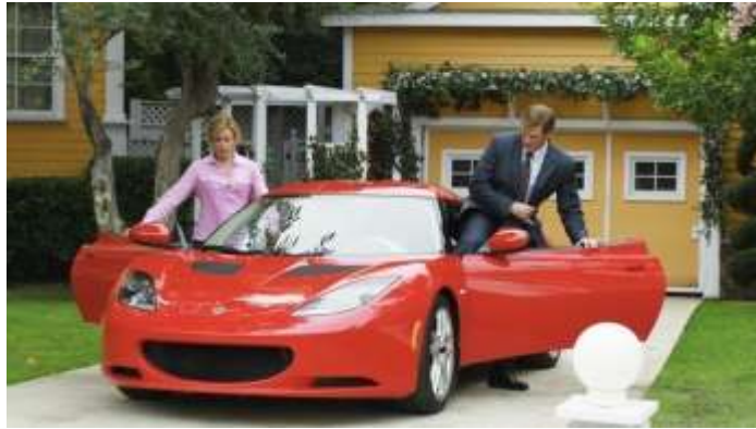
Gambar 2.4 Intergrated explicit Product placement Lotus Evora dalam Desperate Housewives

Desperate Housewives (gambar 5). Pada saat Lynette masuk ke dalam mobil tersebut ia mengatakan “ I can't tell if we're going to drive or fly ”