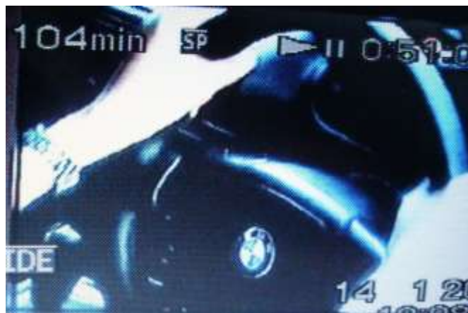
Gambar 5.5 Product placement BMW dalam sinetron Aliya