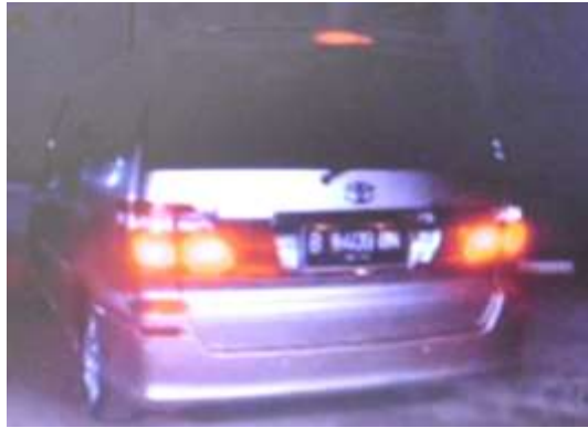
Gambar 5.1 Product Placement Toyota dalam Binar Bening Berlian

Sedangkan pada episode 96, 97, 98, ditayangkan tanggal 31 Januari 2012 terdapat produk placement sebagai berikut: