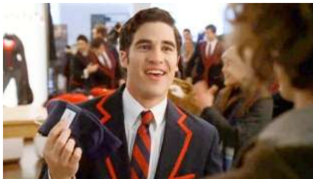
Gambar 2.5 Contoh Implicit product placement . Salah satu adegan dalam serial Glee yang mengambil tempat di toko 'Gap'

Serial Glee yang cukup dikenal di kalangan muda juga tak luput dari muatan product placement . Contohnya pada episode Pilot , terdapat implicit product placement , saat adegan Blaine dan teman-temannya dari Dalton Academy Warblers menyanyi di sebuah toko Gap (gambar 2.5).