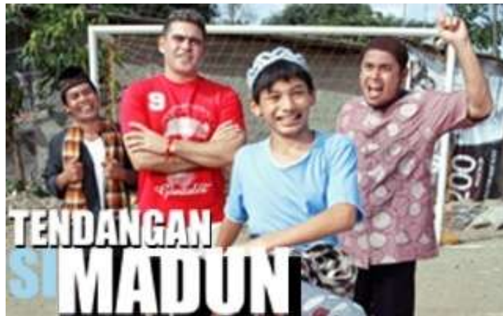
Gambar 3.3. Tendangan si Madun di MNCTV

Madun. Namun begitu Madun selalu dapat melewati hambatan yang dihadapinya (MNCTV).