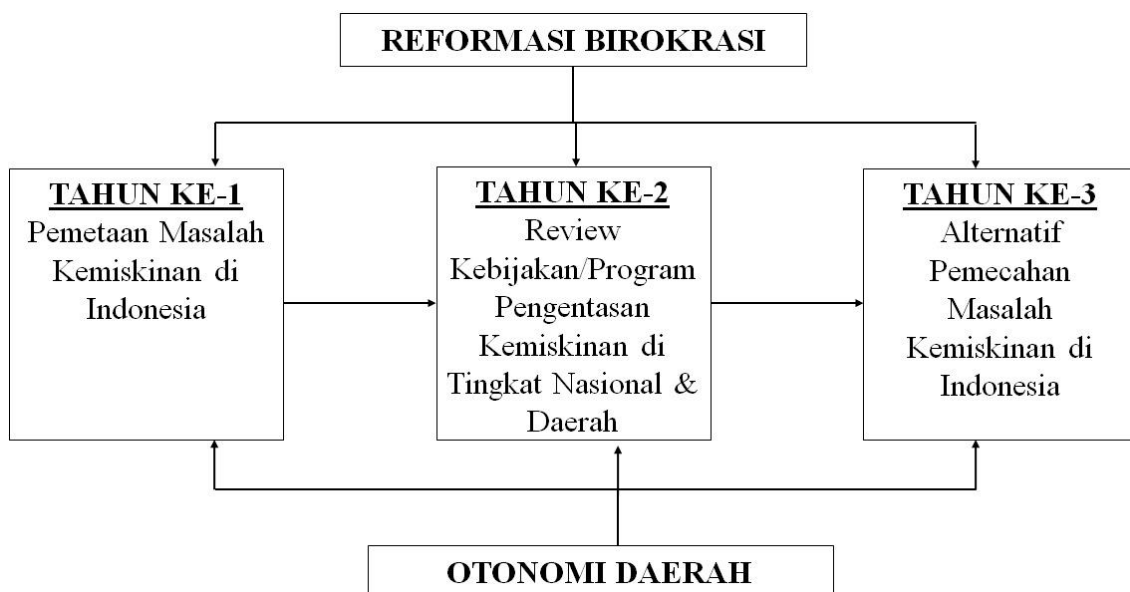
GAMBAR 3.2 Rencana Induk Pengembangan Otonomi dan Desentralisasi Daerah

Penelitian ini akan dilakukan dalam beberapa tahapan penelitian seperti yang sudah dijelaskan di 3.1. (tahapan penelitian) dengan periode penelitian selama satu tahun (Februari 2015 sampai dengan November 2015). Sesuai dengan Rencana Induk Penelitian UNPAR maka penelitian ini akan menjadi bagian dari Roadmap atau Peta Jalan Penelitian Bidang Otonomi dan Desentralisasi Daerah yang digambarkan sebagai berikut: