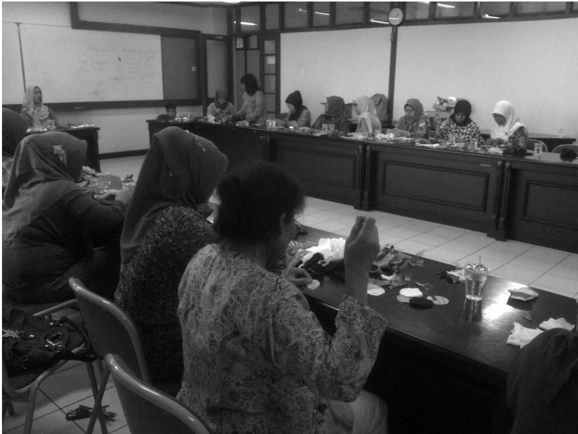
FOTO-FOTO PADA ACARA PENGABDIAN