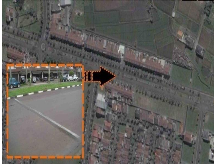
Gambar 2 Batununggal Indah Raya Bandung (Google_maps, 2008)

Data yang digunakan pada studi ini adalah data primer. Data primer ini berupa data tipe kendaraan, kebisingan suara akibat kendaraan, dan kecepatan kendaraan. Kendaraan yang digunakan adalah sedan, minibus, SUV, dan jeep.