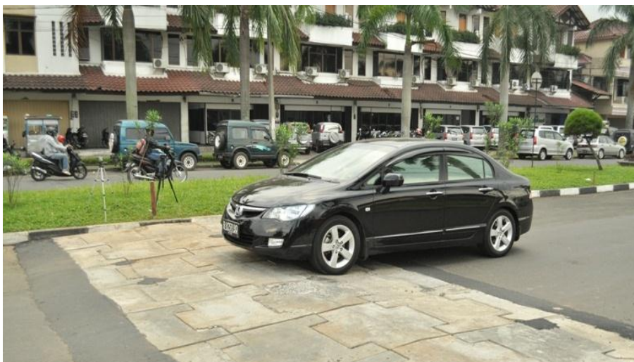
Gambar 3 Bentuk Portable Speed Humps

Perlengkapan utama yang digunakan adalah speed hump dan sound level meter . Speed hump yang digunakan mempunyai tinggi 10 cm dan panjang 400 cm. Lebar speed hump ini disesuaikan dengan lebar jalan tersebut, yaitu 7 m. Speed hump tersebut menggunakan bahan dasar beton aspal dan bersifat portable yang dirancang khusus sehingga dapat dilakukan bongkar pasang, seperti terlihat pada Gambar 3.