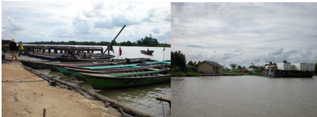
Gambar 3 Dermaga Cabang (kiri) dan Dermaga Antasena (kanan)

Dermaga Antasena berada di Kabupaten Tulang Bawang dan merupakan dermaga yang dilalui oleh rute dari Dermaga Cabang dan Dermaga Sadewa. Kondisi Dermaga Antasena masih berupa lahan kosong, sehingga kebanyakan penyeberangan masih menggunakan dermaga milik perusahaan PT Central Pertiwi Bali (PT CPB).