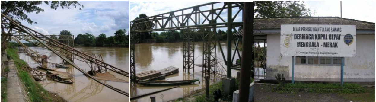
Gambar 2 Dermaga Menggala di Sungai Tulang Bawang

Keberadaan beberapa perusahaan perkebunan, tambak, atau perikanan menimbulkan adanya potensi untuk revitalisasi transportasi sungai, khususnya untuk transportasi barang. Untuk mendukung hal ini diperlukan identifikasi karakteristik kapal yang diperlukan agar dapat beradaptasi dengan kondisi sungai.