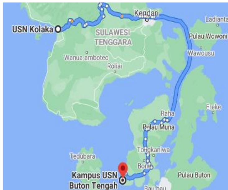
Gambar 1 Lokasi Kedua Kampus USN Kolaka (Google Maps, 2021)

dapat dilihat pada Gambar 1. Untuk meningkatkan aksesibilitas ke masing-masing kampus, diperlukan sarana transportasi laut, yang berupa kapal operasional yang memadai.