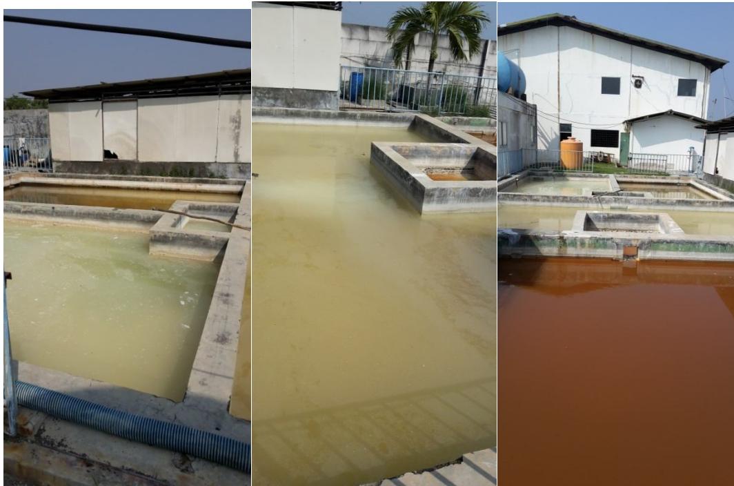
Gambar 1.2 Bak penampung pengolahan limbah: asam dan basa (kiri), pencampuran (tengah), dan pengendapan (kanan)

Pengolahan limbah yang dilakukan di PT. Biotech Surindo masih belum berjalan dengan optimal karena adanya endapan. Endapan tersebut membuat air buangan akhir tidak memenuhi standar baku mutu dan masih memiliki pH yang cukup tinggi. Berjalannya proses secara batch membuat jumlah asam dan basa yang dihasilkan sebagai limbah sangat fluktuatif dalam jumlah dan pH. Rentang nilai pH asam terendah yang pernah dicapai adalah 2 dan nilai pH basa tertinggi yang pernah dicapai adalah 14. Perubahan tersebut dapat terjadi secara harian atau mingguan tergantung dari banyak jenis produk yang diproduksi.