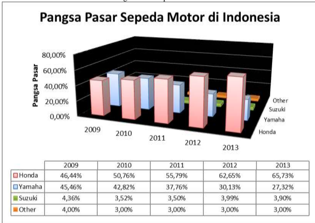
Gambar 1 Pangsa Pasar Sepeda Motor di Indonesia