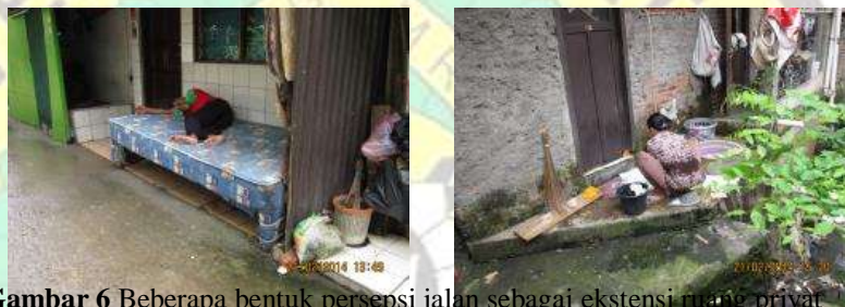
Gambar 6 Beberapa bentuk persepsi jalan sebagai ekstensi ruang privat