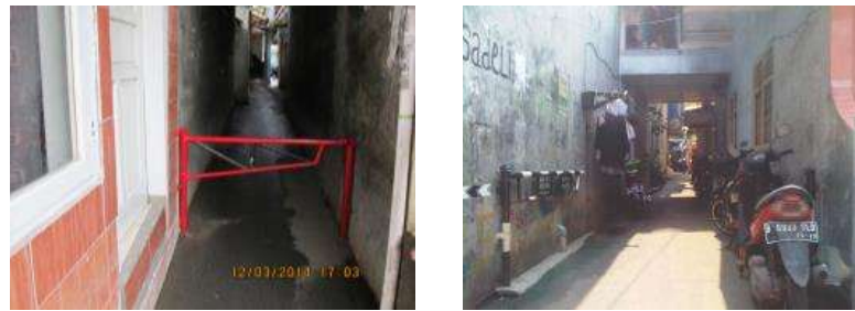
Gambar 8 Beberapa bentuk persepsi jalan sebagai eksklusif