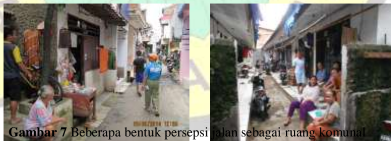
Gambar 7 Beberapa bentuk persepsi jalan sebagai ruang komunal