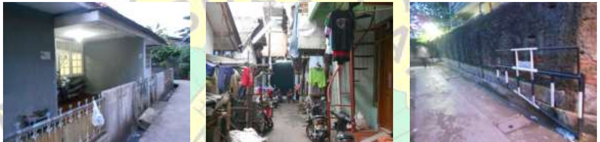
Gambar 5. Bentuk Batas pada Kampung Pluis

Pada ruang Kampung Pluis, pemahaman terhadap batas ini dapat diindikasikan dengan 3 bentuk, yaitu : batas bangunan dengan jalan yang ada di depannya (berbentuk batasan visual seperti pagar, batas yang membedakan dengan jalan, dan tidak adanya batas antara rumah dengan jalan); batas antar bangunan yang bersebelahan yang berupa batas langsung, dan batas tidak langsung (berupa pagar atau batasan visual atau sejenisnya); batas lingkungan berupa batas kolektif berbentuk non fisik yang dapat membatasi aktivitas warga.