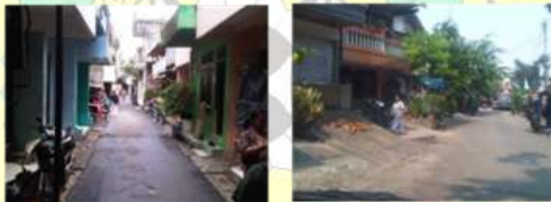
Gambar 3. Jalan yang memiliki peran sebagai sirkulasi dan sebagai akses keluar masuk pada Kp. Pluis

Telaah terhadap orientasi, dilakukan terhadap keberadaan jalan tersebut dalam konstelasi bagian kota sehingga dapat dipahami perannya dalam kawasan, dan orientasi bangunan yang dapat menjelaskan peluang interaksi sosial yang terjadi pada ruang jalan. Dalam telaah terhadap orientasi jalan, pada Kampung Pluis, dapat diketahui 2 jenis peran jalan terhadap kawasan, yaitu jalan sirkulasi yang melayani pergerakan warga antar rumah, dan jalan akses yang melayani mobilisasi keluar masuk warga ataupun orang luar. Dalam konteks orientasi bangunan, pada Kampung Pluis dapat di ketahui 2 pola orientasi yaitu bangunan yang memiliki orientasi pada jalan dan membentuk tatanan yang saling berhadapan, dan bangunan yang menghadap pada bagian belakang bangunan, atau samping bangunan.