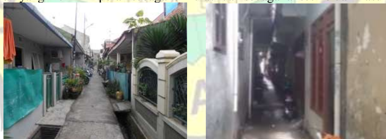
Gambar 4. Bentuk orientasi bangunan yang saling berhadapan dan yang menghadap belakang bangunan lain pada Kampung Pluis

Berdasarkan tinjauan terhadap orientasi tersebut, dapat dilihat beberapa hal, yaitu :