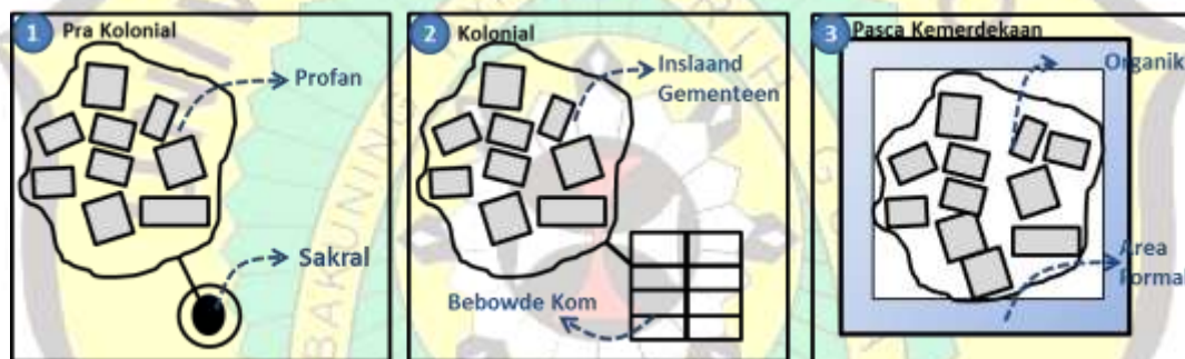
Gambar 2. Stadia Pertumbuhan kampung kota di Indonesia

Pada stadia ketiga adalah pasca kemerdekaan yang merupakan masa perkotaan mengalami berkembang yang pesat. Pada masa ini terjadi pergeseran karakter sosial kampung dari homogen tertutup, menjadi heterogen dan terbuka. Pada masa ini kampung tetap dibiarkan tumbuh sebagai kawasan yang organik dan cenderung tidak tertata dengan konsep pembingkai fisik (Dwisusanto, 2006). Untuk memperjelas gambaran stadia Kampung Kota ini dapat dilihat pada ilustrasi berikut ini.